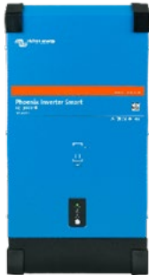
Phoenix-växleriktare Smart 12/3000