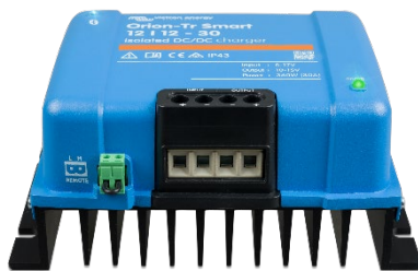
Orion-Tr Smart 12/12-30