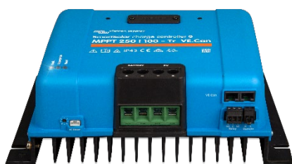
SmartSolar laddningsregulator: MPPT 250/100-Tr VE.Can utan skärm