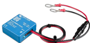
Bluetooth-avkänning: Smart Battery Sense