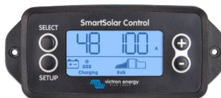
SmartSolar pluggbar skärm