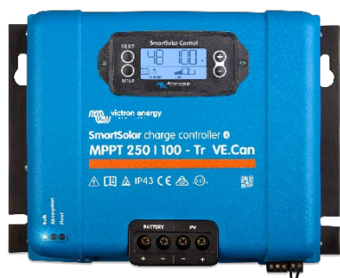
SmartSolar laddningsregulator: MPPT 250/100-Tr VE.Can med pluggbar skärm som tillval