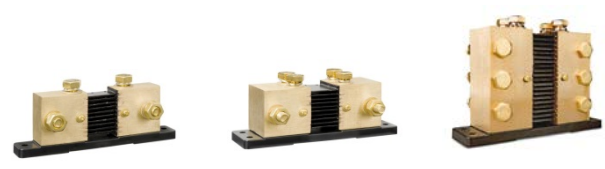
1000 A/50 mV, 2000 A/50 mV och 6000A/50 mV shunt Snabbanslutnings-PCB på standard 500 A/50 mV shunt kan också användas på dess shuntar.