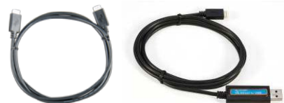
Gränssnittskablar - VE.Direct kablar för att ansluta en BMV 712 till Colcr Control (ASS030530xxx) - VE.Direct till USB-gränssnitt (ASS030530000) för att ansluta flera BMV 70x till Color Control eller en dator.