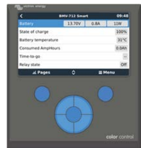
Color Control Den kraftfulla Linux-datorn, gömd bakom färgdisplayen och knappar, samlar in data från alla Victron- utrustningar och visar dem på skärmen. Förutom att kommunicera med Victron- utrustningar kommunicerar Color Control via CAN-bus (NMEA2000), Ethernet och USB. Data kan lagras och analyseras på VRM- portalen.

En 48 V batteribank kan balanseras med 3 balanseringsenheter.