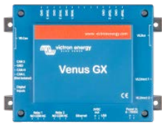
Venus GX Venus GX ger intuitiv kontroll och övervakning. Den har samma funktion som Color Control GX med några extra detaljer: - lägre kostnad, främst p.g.a. den inte har någon skärm eller knappar - 3 tanksändaringångar - 2 temperaturingångar