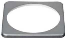
BMV fyrkantig ram