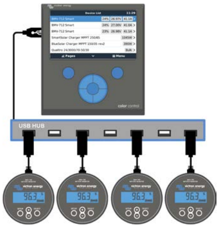
Maximalt fyra BMV enheter kan anslutas direkt till Color Control. Ännu fler BMV enheter kan anslutas till en USB-sticka för central övervakning.