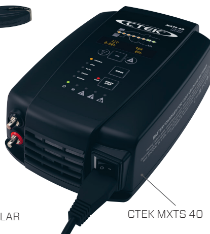
CTEK MXTS 40